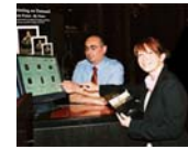
MyCollection Kunsthistorisches Museum Wien